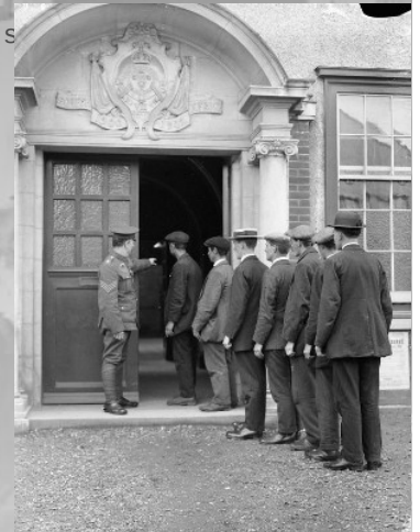
Recrutement et engagement volontaire en Grande- Bretagne, 1914-1918

La réflexion sur les mises en guerre de l'État est restreinte à des enquêtes précises, limitées à des objets abordés de manière empirique.