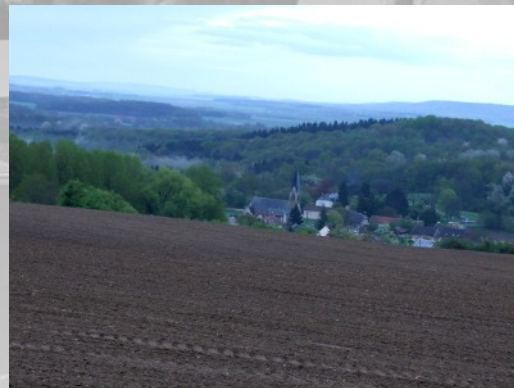
Le village de Craonne, au pied du Chemin des Dames

Le village a bénéficié de l'aide internationale. C'est ainsi la Suède qui a financé l'imposant Hôtel de Ville et sa vaste salle des mariages.