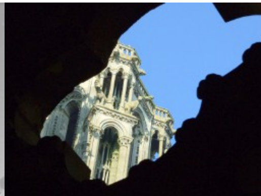
Cathédrale de Laon

Le Conservatoire est installé, depuis 2005, au pied du Plateau, sur le site de l'ancienne caserne. Son auditorium peut accueillir 255 personnes.