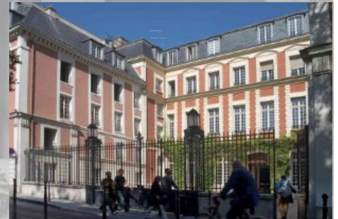
L'Institut historique allemand, à Paris

Il a été fondé le 21 novembre 1958 à Paris avec pour objectifs une entente durable entre la France et l'Allemagne et le soutien aux projets de la recherche historique allemande. Il est installé, depuis 1994, à l'Hôtel Duret de Chevry, dans le quartier du Marais.