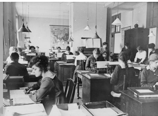
Le bureau d'information sur les prisonniers de guerre, Londres

L'État est entendu au sens le plus large de la puissance publique sous toutes ses formes. En effet, l'État central à la française n'est qu'une de ces formes possibles et qu'il est accordé le plus grand intérêt aux démarches permettant l'étude d'autres situations nationales et d'autres modèles étatiques (multinationaux, fédéraux, impériaux, etc.) éventuellement dans un cadre comparatif. Le colloque s'attache ainsi à observer l'État à toutes les échelles et sur les différents types de territoires qu'il recouvre : de la commune au pays, l'arrière et l'avant, la zone des armées, les territoires occupés, les colonies, etc.