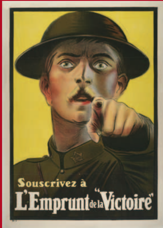
Affiche de propagande canadienne, auteur inconnu. 1917-1918. Musée canadien de la guerre