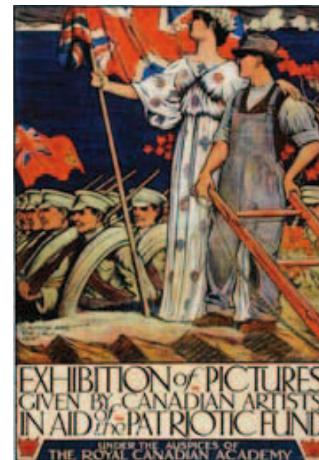
Le Canada (sous les traits de la femme au drapeau) et l'appel. Affiche de J.E.H. MacDonald produite par l'Académie royale du Canada. Musée canadien de la guerre.

À l'image d'une précédente manifestation scientifique organisée autour des mutineries de 1917, le colloque est à la fois centré sur 1914-1918 et ouvert sur des temporalités plus longues et une comparaison avec la Seconde Guerre mondiale. Largement ouvert dans l'espace et dans le temps autour du point de référence de 1914 et composé d'enquêtes bien circonscrites, ce colloque permet de questionner ce qui semble une évidence, au moins en France : la spectaculaire capacité de l'État de prendre en charge, presque du jour au lendemain, une société