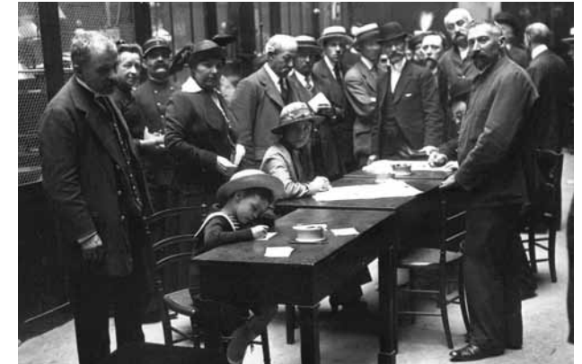
A la Banque de France, le change de l'or contre billets de banque : un enfant confectionne son bulletin. 1915.