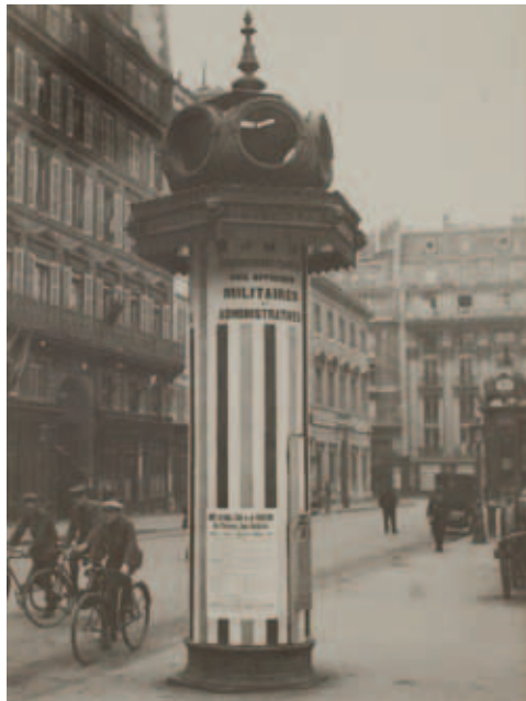
Paris, octobre 1914. Kiosque réservé aux affiches militaires et administratives.

Les deux journées suivantes sont prévues successivement à l'auditorium de la Maison de l'agriculture, 1 rue René Blondelle à Laon, et à la salle des mariages de la mairie de Craonne.