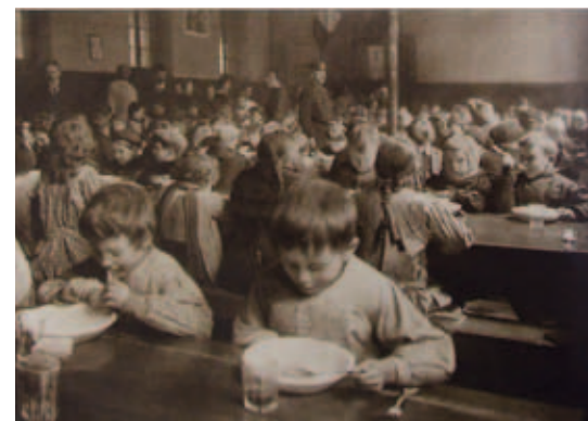
Le « secours de guerre » à l'ancien séminaire Saint-Sulpice. Enfants de réfugiés au réfectoire. Photographie publiée dans l'illustration du 7 avril 1917.